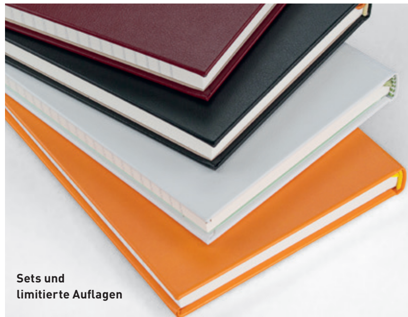
Sets und limitierte Auflagen