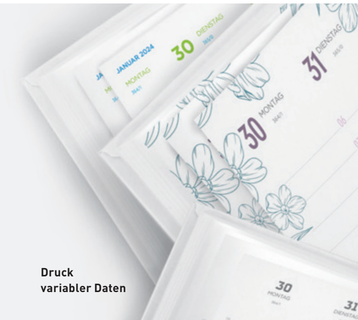
Druck variabler Daten